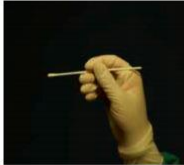
мал. 1. Паличка з тампоном взята правильно

безпечному напрямку, в другому - рух палички буде обмежений, тому пацієнт може травмуватися.