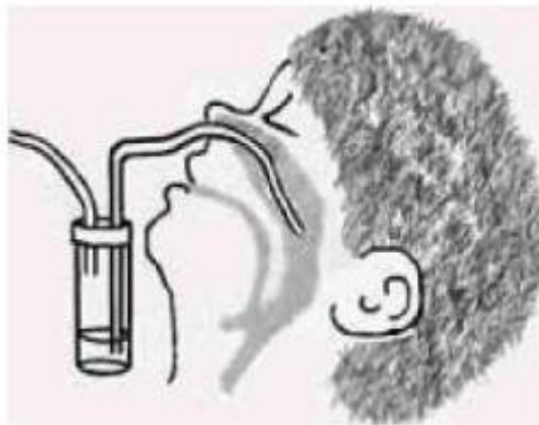
мал. 5. Взяття фарингального аспірату

якщо руки видимо не забруднені, обробити спиртовмісним антисептиком для рук.