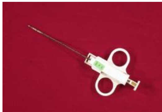
мал. 6. Біопсійна голка для відбору зразків секційних матеріалів

для мінімізації інфікування персоналу застосовувати біопсійну голку (мал. 6);