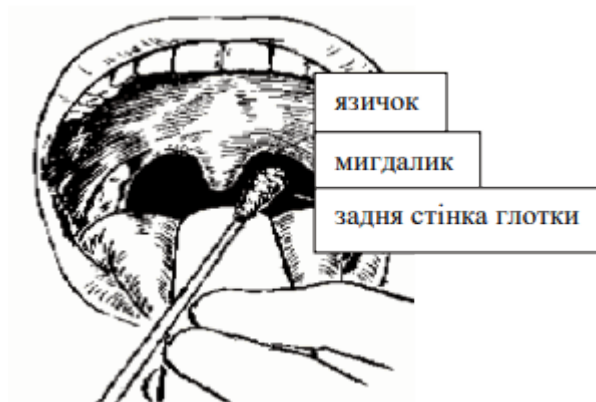
мал. 3. Взяття зразка із зіву

якщо руки видимо не забруднені, обробити спиртовмісним антисептиком для рук.