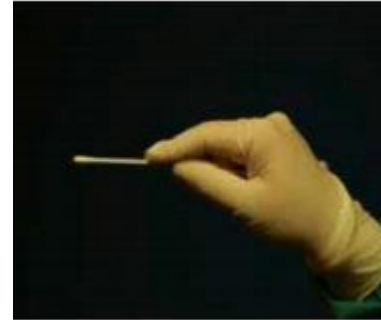
мал. 2. Паличка з тампоном взята неправильно