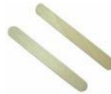
Зразок шпателя для язика (для взяття мазків із зіву)