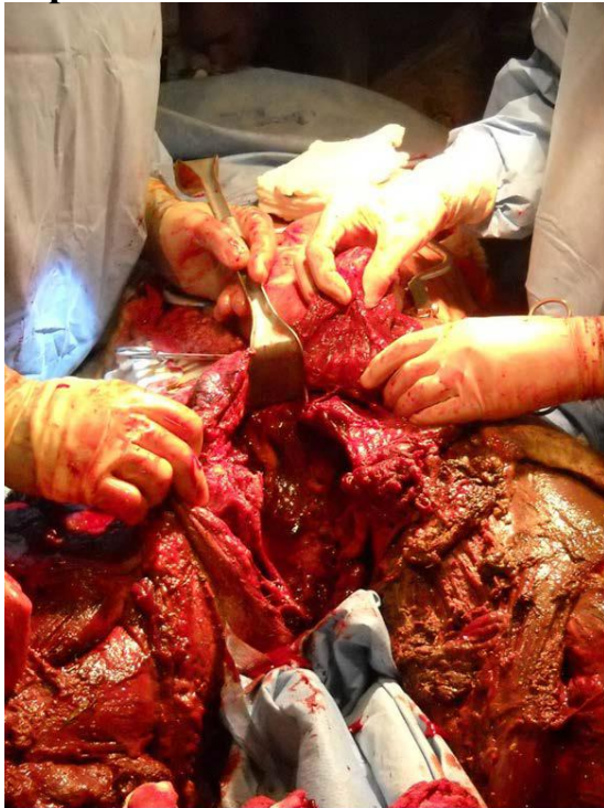
Рисунок 1. Складні вибухові травми в пішому строю