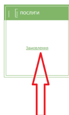
Рис. 6. Головна сторінка кабінету замовника. Вхід для створення замовлення на послуги

На сторінці «Замовлення» (рис. 7) користувач створює нову картку замовлення на послуги.